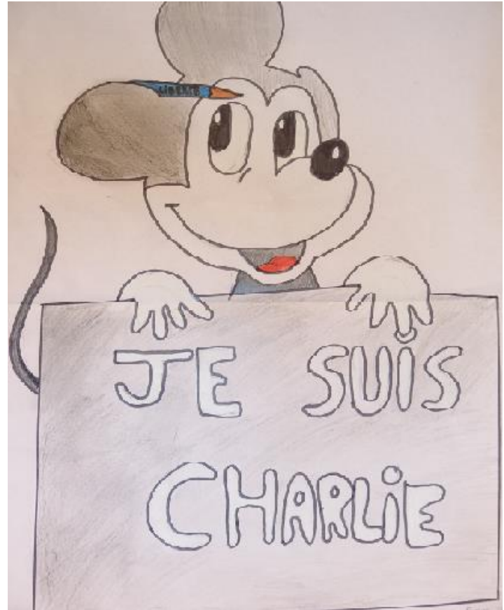
Texte der Schüler Klasse 6 und 8 im Unterricht von Frau Stübinger und Frau Ritte